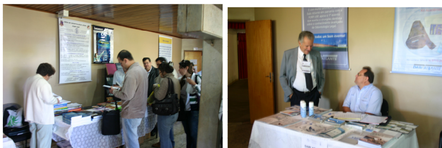
Figura 2 – Feira comercial do evento.