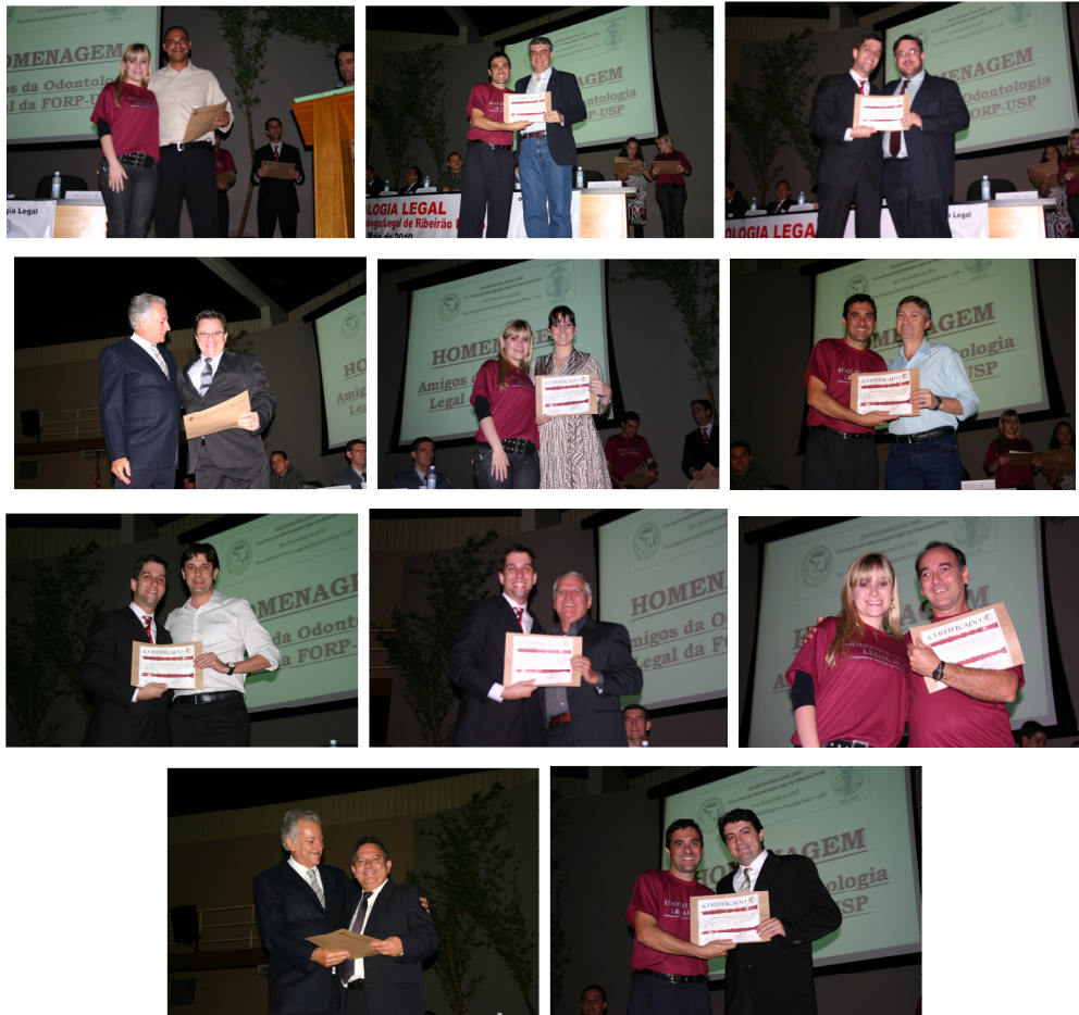
Figura 11 – Homenagem aos “Amigos da Odontologia Legal da FORP-USP”, agraciando com certificado entidades e personalidades imprescindíveis para a realização do evento.