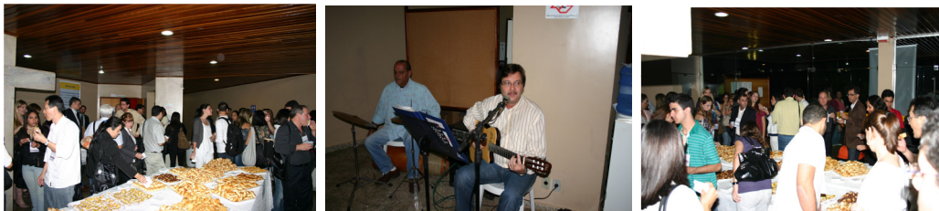
Figura 12 – Coquetel de abertura do evento.