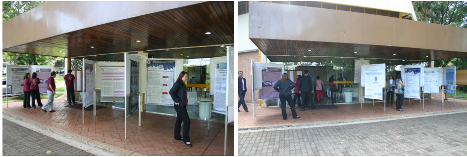
Figura 18 – Apresentação dos trabalhos científicos.