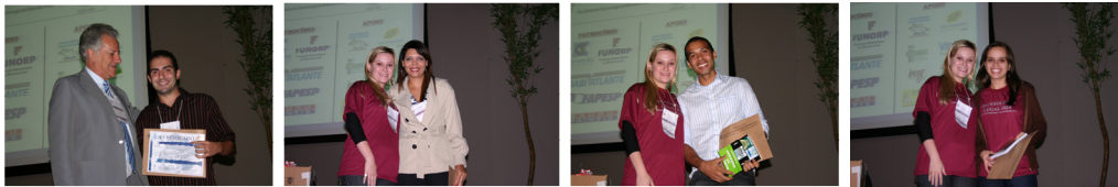
Figura 19 – Premiação dos trabalhos científicos apresentados.