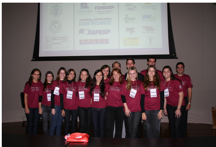
Figura 20 – Comissão Organizadora.