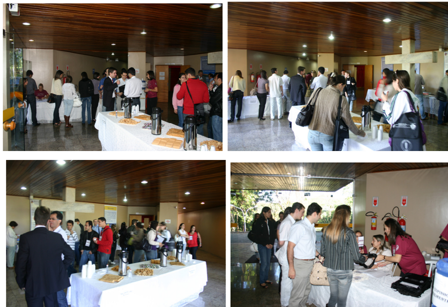
Figura 1 – Recepção aos congressistas (serviço de secretaria do evento e coffee-break).